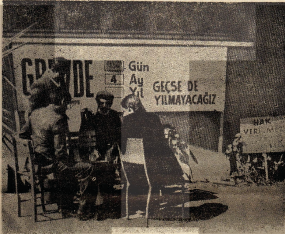
DISK'e bağlı Basın - İş Sendikasının İzmir Ticaret Matbaasında 5 aydır sür- düğü grev, işverenin Toplu İş Sözleşmesini imzalamayı kabul etmesi nede- niyle sona ermiştir. İmzalanan Toplu İş Sözleşmesi ile işçiler bir çok sosyal haklar ve ücret zamları almışlardır.

İşyeri tamamen de ka- panmış olsa Toplu İş Söz- leşmesinin 19. ncü mad- desine göre Baş'emsilci ve Temsilcilere çıkış ve- rilmez ve çıkıştan sonra boş gezdikleri günlerin ücreti İşveren tarafın- dan ödenir.