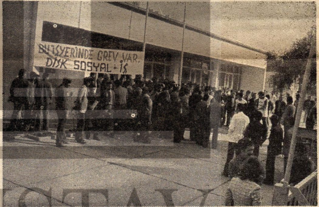
Sosyal - İş, SSK'nın 104 işyerinde aldığı grev kararını, 13.3.1975 günü 9 işyerinde uygulamaya koydu. Resimde SSK Antalya Şube Müdürlüğü işyerindeki grevden bir görünüm.

İşçi Kardeş Gezete senindir Oku, Okut Köyüne gönder